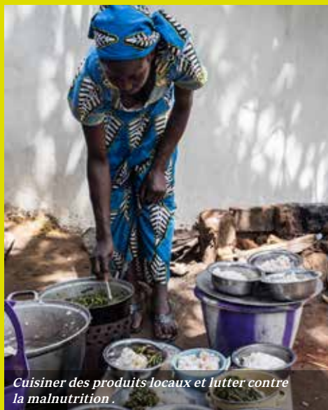
Cuisiner des produits locaux et lutter contre la malnutrition.