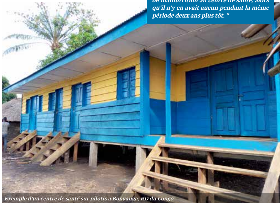
Exemple d'un centre de santé sur pilotis à Bonyanga, RD du Congo.