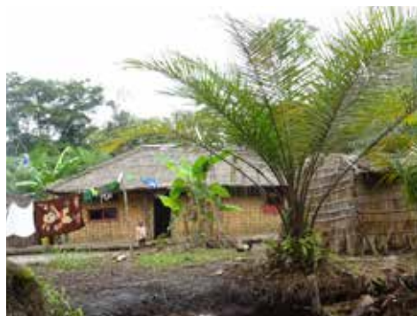
Village de Bondanga.

11% des habitants de Bondanga ont déjà été contraints de se déplacer. Certains se sont installés dans des villages voisins où il y a des terres fertiles, mais cela entraîne des tensions avec les habitants et parfois même des conflits fonciers. D'autres se déplacent vers les villes et sont ensuite exposés aux risques (sanitaires) liés à ce mode de vie, tels que le chômage et la pollution atmosphérique.